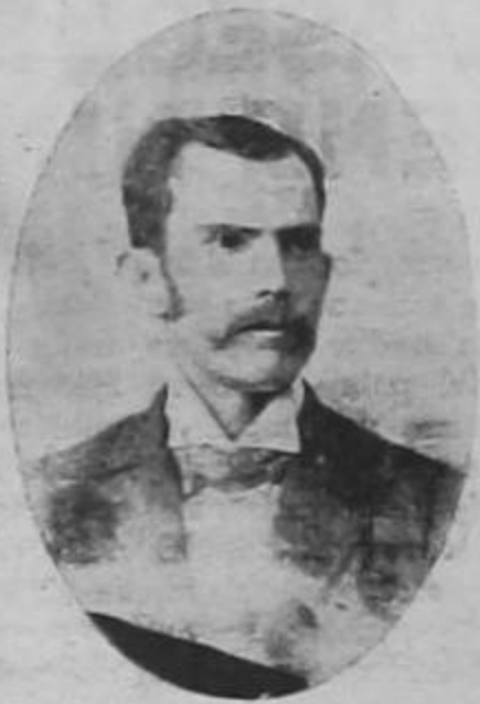
Don Carlos Volio Tinoco a los 32 años de edad

rizadas, por ser buen negocio, en todas las regiones centrales del país, hasta que vino el alza del precio del café (1885) que subió de 8 a 40 pesos la fanega, por lo que todo mundo se dedicó a la siembra de ese grano, abandonando todo otro cultivo, por lo que fracasara su empresa aceitera. En 1886 estableció el señor Volio en esta capital la industria de la confección de hielo con una máquina, movida a fuerza hidráulica, que producía cuatro quintales diarios y que vendía a razón de 25 centavos, y que tiempo después la repusiera por otra más